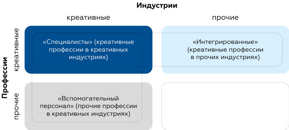
Табл. 9. Группы занятых в креативной экономике («креативный трезубец»)

Источник: составлено авторами на основе [Higgs et al., 2008].