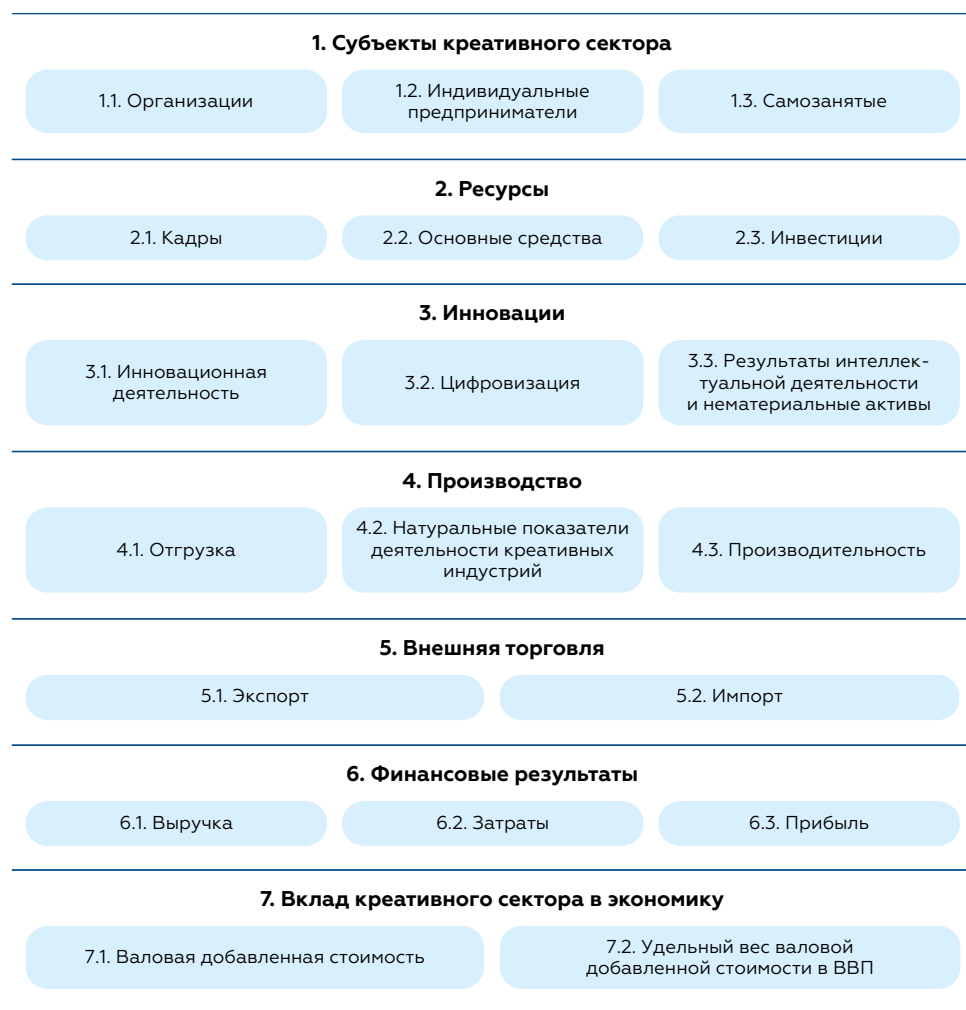
Рис. 3. Концептуальная модель системы базовых показателей деятельности организаций креативного сектора