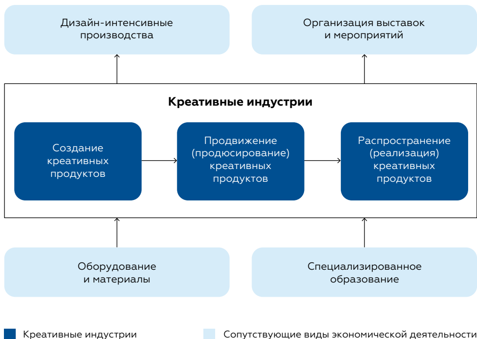
Рис. 2. Концептуальная модель креативного сектора