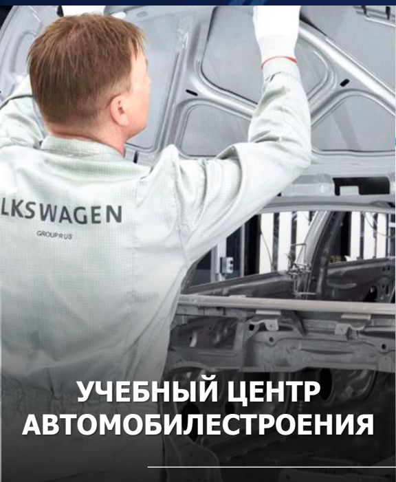
УЧЕБНЫЙ ЦЕНТР АВТОМОБИЛЕСТРОЕНИЯ